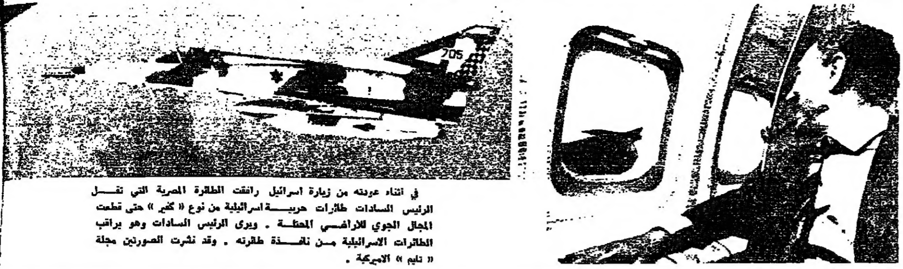
في أثناء عودته من زيارة اسرائيل رانقت الطائرة المصرية التي تقل الرئيس السادات طائرات حربية اسرائيلية من نوع « كير » حتى قطعت المجال الجوي للاراضي المحتلة . ويرى الرئيس السادات وهو يراقب الطائرات الاسرائيلية من نافذة الطائرة .